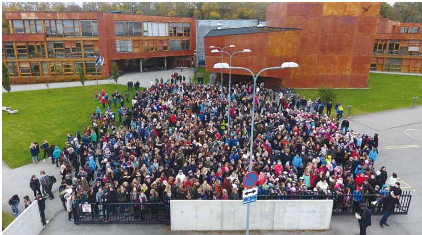
Viimsi Kooli pere ootab teid!