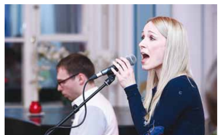
Lenna esituses kõlasid tuntud hitid, aga ka vähemtuntud lood.