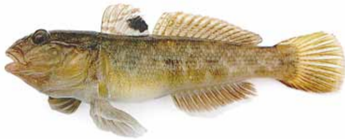
Ümarmudil on tulnud Läänemerele, et jääda, ning tuleb otsida võimalusi, kuidas temast kasu saada.