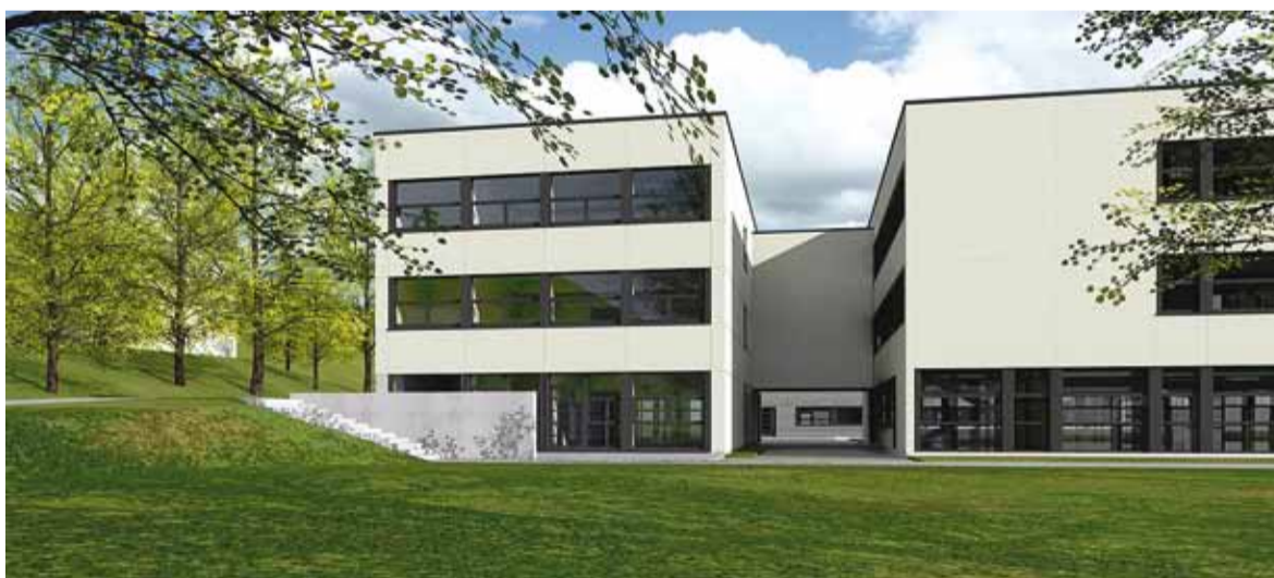
Selline näeb tulevikus välja Haabneeme Kooli juurdeehitus. 3D-eskiis AS Eviko

Juurdeehitusega korrastab ja laiendab Viimsi oma haridusvõrku, vastavalt 2016. lõpus kinnitatud valla haridusvõrgu arengukavale.