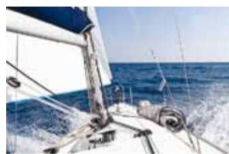
Sadam pole enam kaugel.

Kesk-Läänemere programmi 30 MILES (30 miili) projekti raames arendatakse Eesti ja Soome idapoolseid sadamaid, sh ka Kelnase ning Leppneeme sadamat.