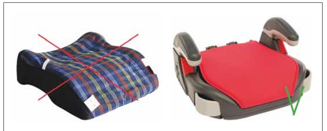
Kindlasti ei tohi kasutada sangadeta istet.