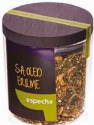
Filmi vaadata, raamatut lugeda, muusikat kuulata... ja seda kõike siis, kui kõrval on tass kuuma teed.