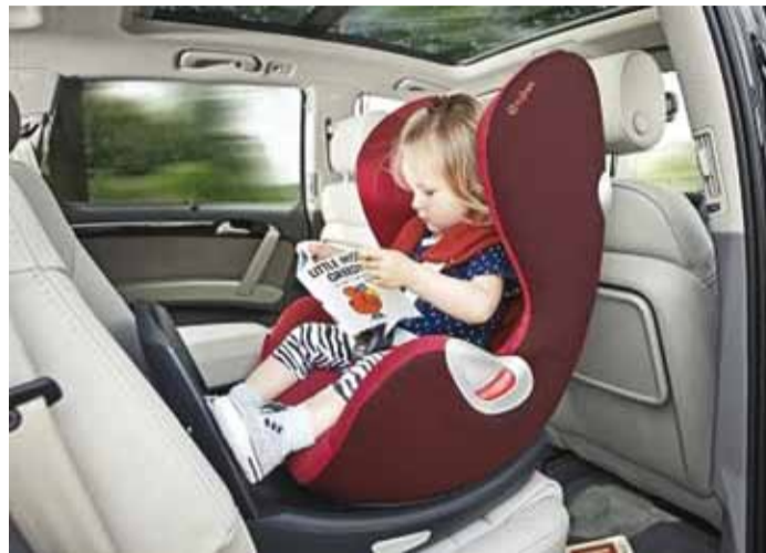
Väikesed lapsed peaksid sõitma seljaga sõidusuunas. Fotod tootjad

Ohtlik ei ole see, kui jalad ulatuvad üle turvahälli, vaid see, kui pea ulatub üle seljatoe serva.