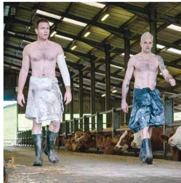
21 aastat tagasi vändatud Danny Boyle'i kultusfilmile "Trainspotting" on seipsetud järg.

Saksa keelt eriti tihti kinosaaalis ei kuule. Selle vea aga parandab draamakomöödia "Minu pimekohting eluga", mille peategelane on kaotanud pea 95% oma nägemisest, ent püüdleb sihikindlalt oma eesmärgi poole. Ja see pole arvestades olukorda mingi tühine eesmärk. Nimelt tahab Saliya pääseda tööle Müncheni kõige mainekamasse 5 tähni hotelli. Abiks on tal sealjuures sõber Max, kellega koos püütakse siis noorsandi puuet varjata. Plaan paistab töötavat õlitatult, siis aga astub mängu kena näitsik nimega Laura. Lustliku jandi aluseks on tõestisündinud lugu.