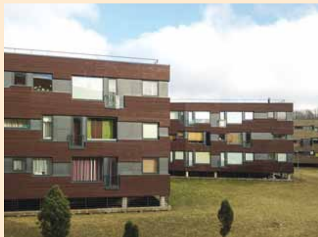
14. märtsil toimub korterühistute infopäev.

Eesti Korterühistute Liit koostöös Ida-Harju konstaablijaoskonnaga kutsus Viimsi korterühistute esindajaid 14. märtsil Rae kultuurikeskusesse infopäevale.