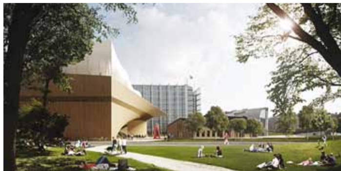
2018. a valmiv raamatukogu Oodi Helsingis. Foto Ala Arhitektid

Missugune peaks olema 21. sajandi raamatukogu? Soomlased on selle küsimuse lahendanud, sest Helsingi südalinna kerkib uus linnaraamatukogu hoone Oodi. See on ka kingitus Soomele 100. aasta juubeliks.