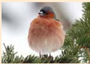
Metsvint on aedades värvikas ja põnev külaline.

Eesti Ornitoloogiaühingu rahvateadusprojekt "Suvine aialinnupäevik" alustas oma neljandat hooaega. Ootame aialinnupäevikuga liituma kõiki loodushuvilisi, et üheskoos jälgida meie aedades pesitsevate linnuliikide leviku ja pesitsusedukuse muutusi ning saada uusi teadmisi aialooduse kohta teravikuna.