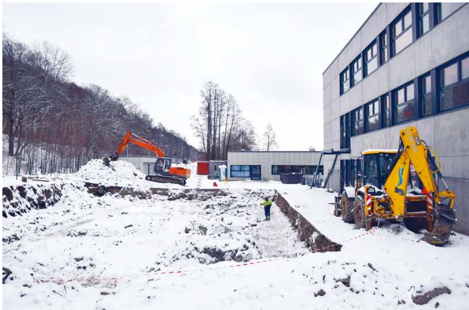
Kooli juurdeehitustööd on alanud!

Viimsis algasid Haabneeme Kooli juurdeehitustööd. Olemasolevale koolimajale lisanduv kolmekordne juurdeehitus, mille ehituslik maht on 1000 m 2 , valmib 2017. aasta sügiseks.