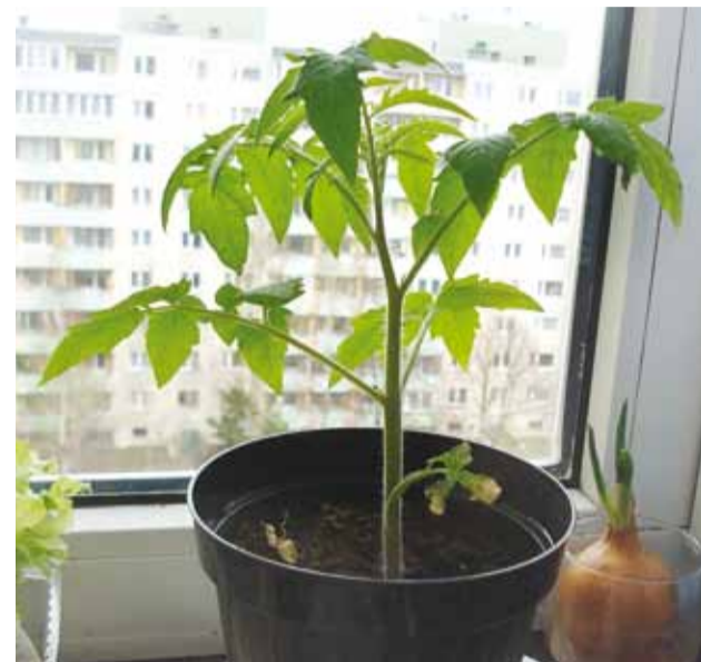
Tomati ettekasvatamine nõuab üksjagu vaeva, aga kui taim kasvab ja vilja kannab, on rõõm seda suurem.

Parim külviaeg tomati jaoks on märtsi teine pool – 20. kuupäeva paiku – juhul, kui soovime neid mai keskel istutada tavalisse kütteta kasvuhoonesse.