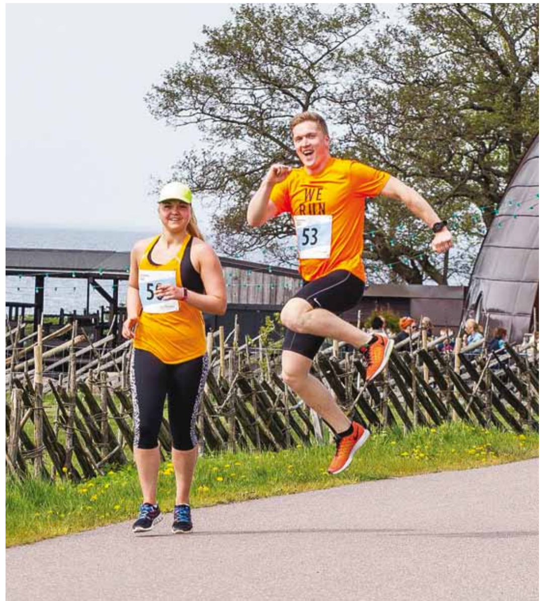
Soojade ilmade saabudes saab juba Viimsi radadel jooksuks treenima hakata. Hetk möödunud aastal toimunud jooksupäevast.

Viimsi elaniku soodustuse (-20%) saamiseks tuleb teha vastav märge registreerimisvormil, mille leiad www.myfitness.ee/event/viimsijooks2017/registreeru .