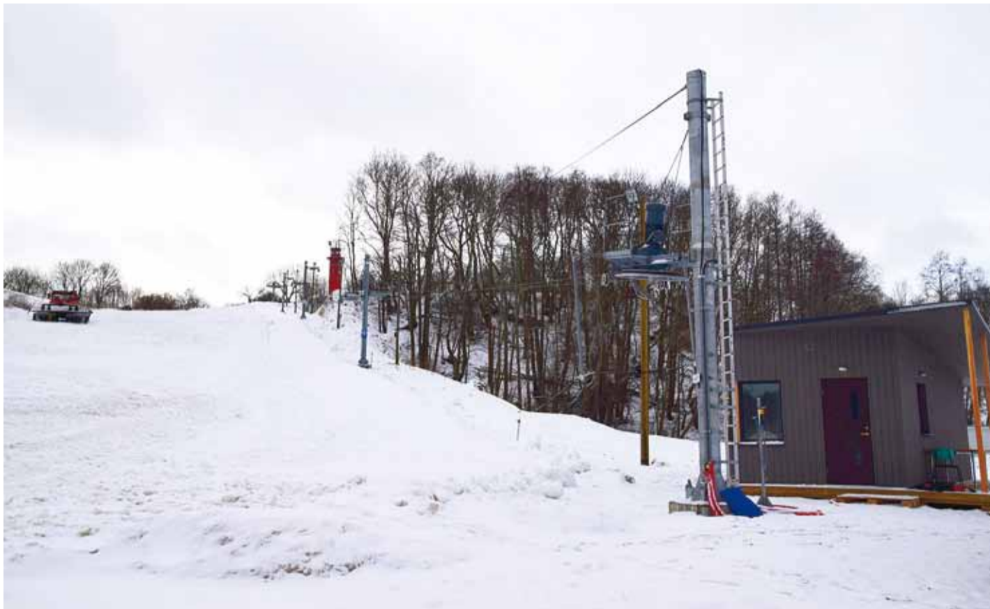
Vimka on lund isegi nii palju, et saab ehitada lumepargi.