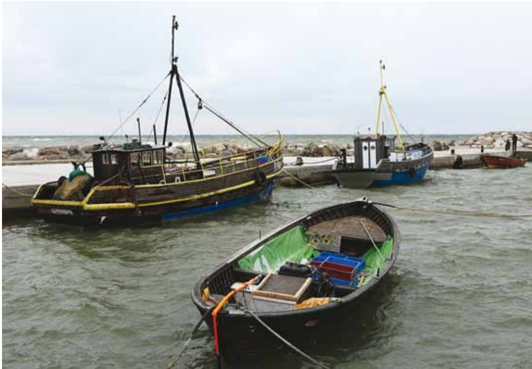
Laine löi vahtu ja paadid Leppneeme sadamas kõikusid tugeva tuule käes.