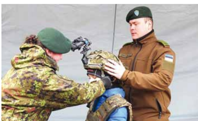
Kõigil soovijatel oli võimalus proovida sõdurite lahingvarustust. Kui palju võiks kaaluda sõduri kiiver koos öövaatlusseadmega?