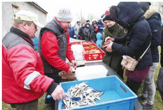
Järjekord kalaleti ees kahanes visalt.