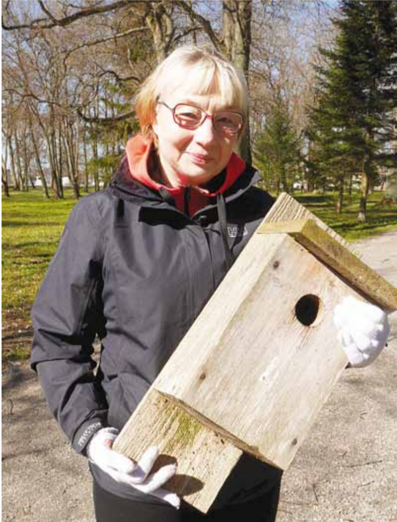
Lindude paigaldati uued korterid, pesakastid on lindude hulgas kõrges hinnas.

6. mai on talgupäev. Allpool on toodud info Viimsi valla talgute kohta, lisainfot saab www.teemeara.ee lehelt (täpsemad talgutööd ja tegevused, info toitlustuse olemasolu kohta jmt). Leia enda jaoks sobivad talgud ja löö kampa! Tööd jagub kõikidele ja igauks on oodatud!