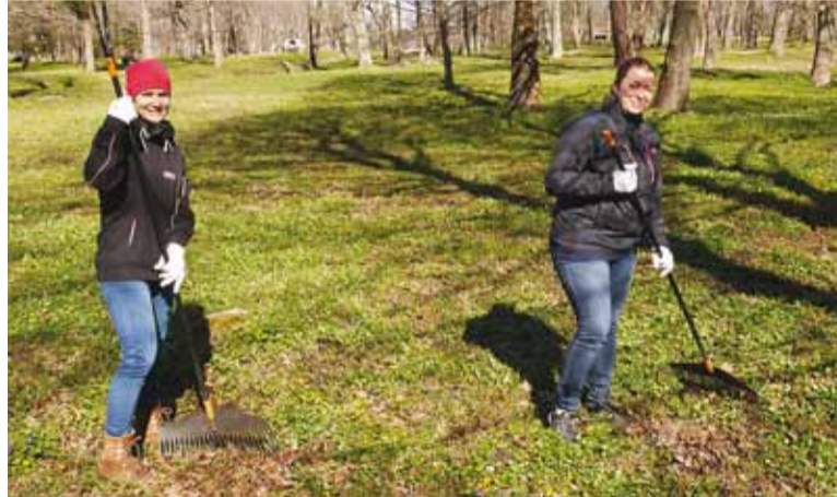
3. mail toimus Möisapargis Viimsi vallavalitsuse talgupäev. Park koristati prahist ning riisuti suuremad lehed.