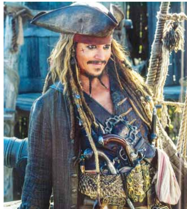
Johnny Depp piraadikapten Jack Sparrow rollis seikleb juba "Kariibi mere piraatide" viiendas osas.

Kuidas on privaatsusega interneti ja sotsiaalmeedia ajastul, kui osa meist igast sammust oma sõpradele, tuttavatele ja pea tervele maailmale teada annavad. Seda teemat vaeb David Eggersi samanimelisel bestselleril põhinev põnevik "Ring". Mis juhtub, kui oled oma elu vabatahtlikult kõigile nähtavaks teinud? Seda kogeb üsna pea Harry Potterist tuttava Emma Watsoni tegelaskuju Mae, kes nõustub osalema programmis "Täielik läbipaistvus". Kandes tibatillukest kaamerat on ta 24/7 nähtav tervele maailmale. Põnev? Loomulikult. Privaatne? Absoluutselt mitte.