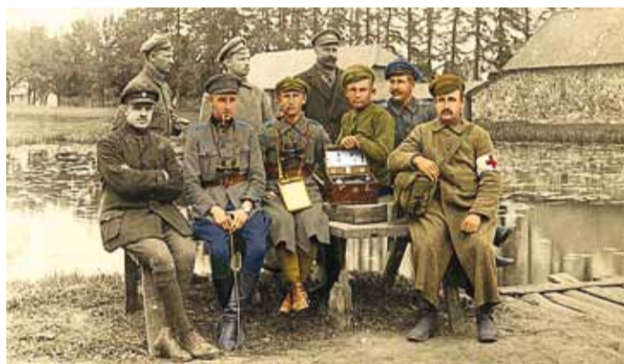
Grupp jalaväelasi Vabadussõja päevil.

Kokku on näitusel 14 vormi kandvat mannekeeni, mõni vorm lisaks ja vaid kaks neist on koopiad.