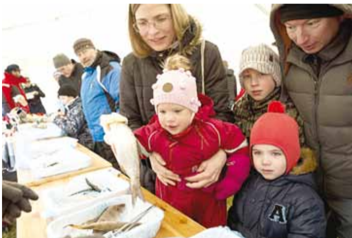
Kalade õpitoas sai mereelukatega lähemalt tutvust teha.

Vaatamata tormisele ja külmale ilmale kogunes laupäeval, 29. aprillil Leppneeme sadamasse hulk inimesi, et osa saada avatud kalasadamate päevast.