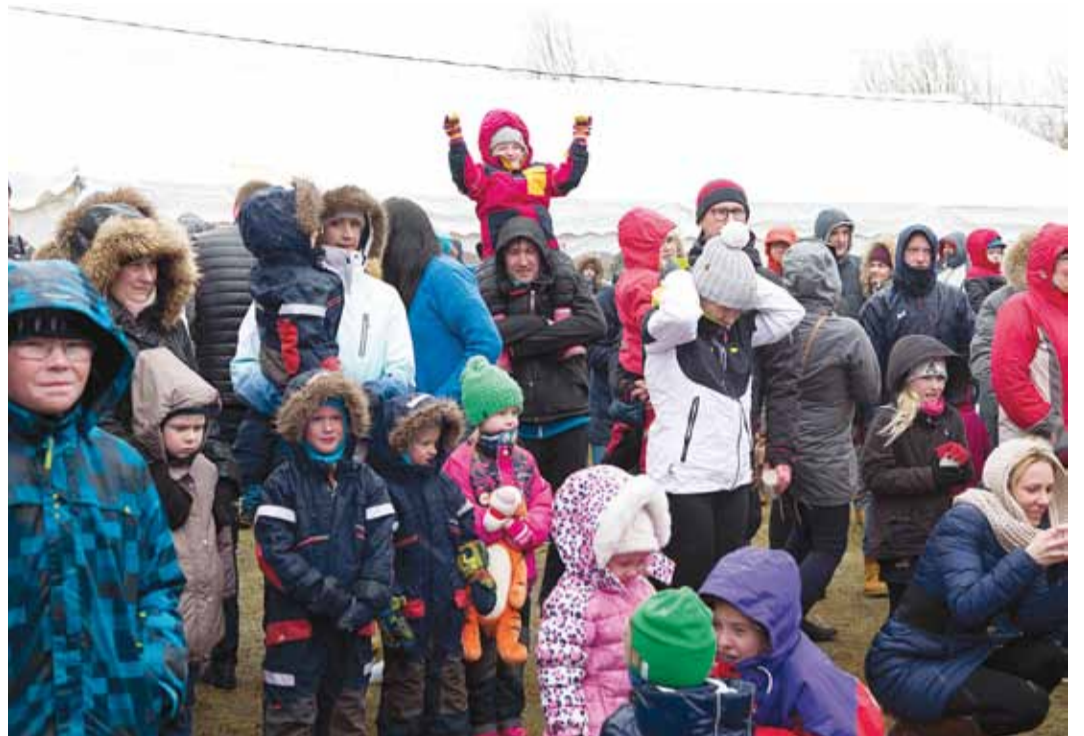
Kontserdile elasid kaasa nii suured kui ka väikesed.