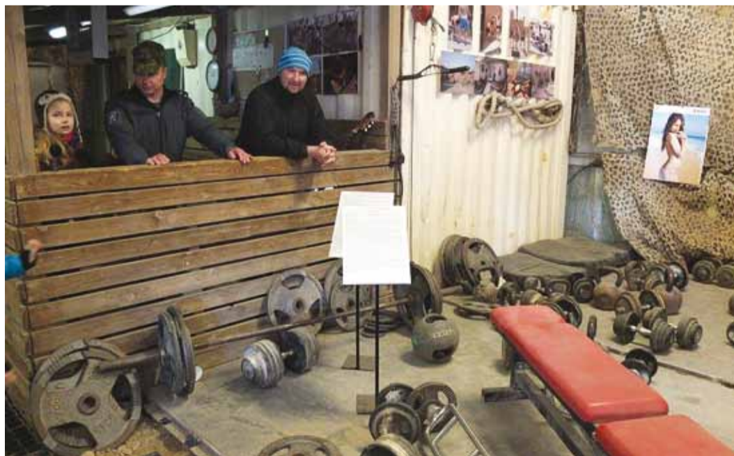
Veteranid tutvustasid elu missioonil.