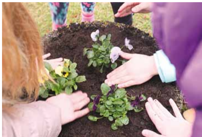
Iga klass sai omale kooliõuele poti, kuhu istutati lilled, mille eest ka edaspidi hoolitsetakse ja nii endas kohusetunnet kasvatatakse.

Inimene teeb vahet heal ja halval või õigel ja valel just oma väärtushinnangute põhjal. Need väärtushinnangud ei kujune aga iseenesest, neid tuleb lastele õpetada ja kinnistada. Selleks on Püünsi Koolis sel aastal korraldatud juba mitmeid üritusi ja tegevusi. Väärtuste õppimist on seotud erinevate ainetundide ja üritustega. Emakeelepäeval näiteks koos-