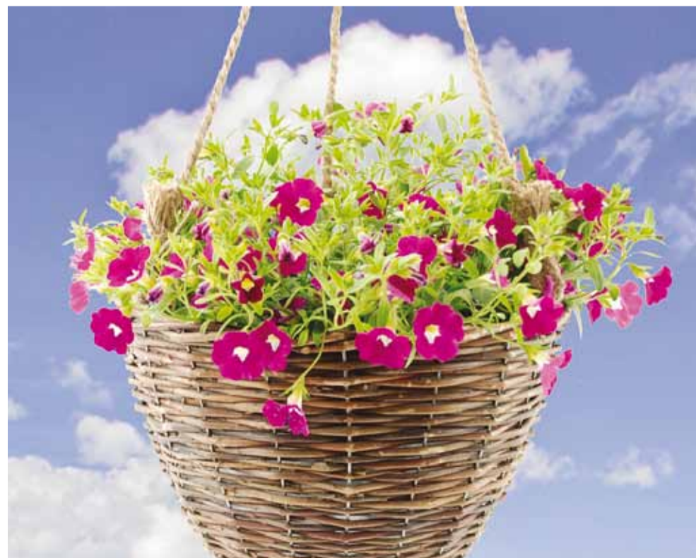
Ampliga saab kiirelt rõdu või aia suvisemaks muuta.