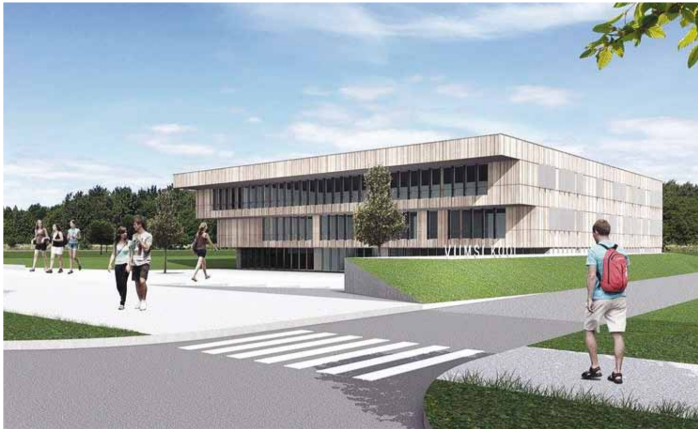
2018. aastal avatakse Viimsis uus gümnaasium – Viimsi riigigümnaasium. Järgmisena võiks tulla ka ülikool. 3D-eskiis Novarc Group AS ja KAMP Arhitektid OÜ

2018. aastal avab ukseid Viimsi riigigümnaasium, mis oma esimesed lõpetajad lennatab ellu 2021. aasta jaanipäeval. Miks küll peaksid need ini-