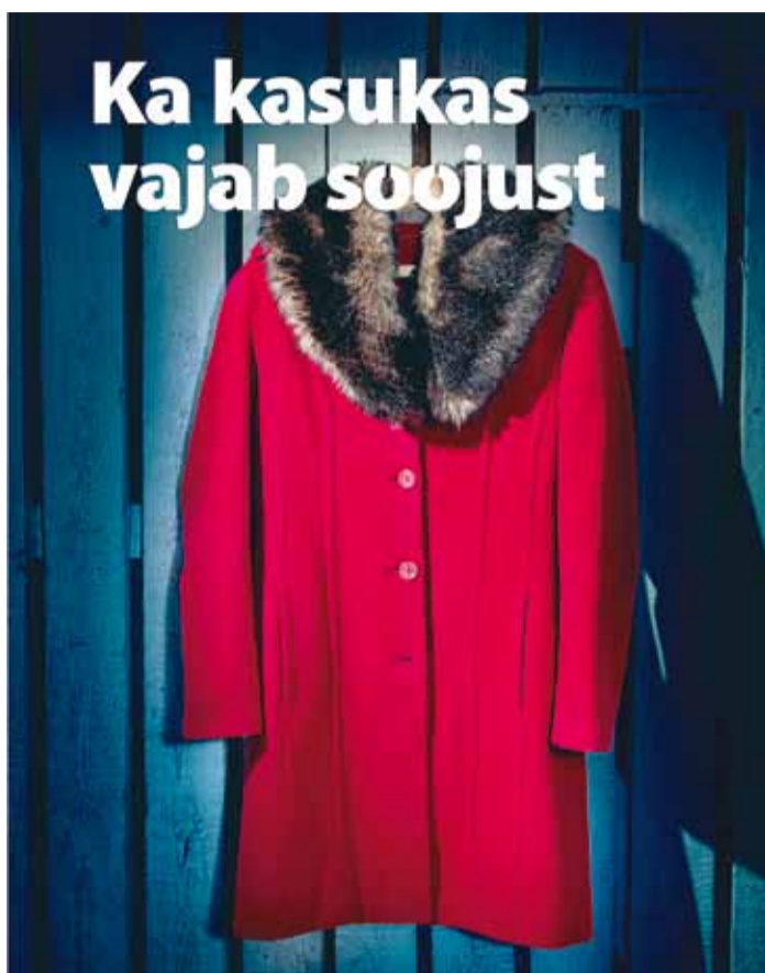
Sinu vana on teise uus.

Nädala sees on aga Viimsile lähim võimalus viia asjad Lasnamäele Mahtra 5 ja Punane 50 asuvasse Uuskasutuskeskusesse. Neis võetakse annetusid vastu esmaspäevast reedeni kell 10–18 ja laupäeviti kell 10–16. Suuremate annetuste, na-