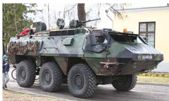
Soomustransportöör Pasi XA 188 on üks Eesti Kaitseväe lahingmasinatest.