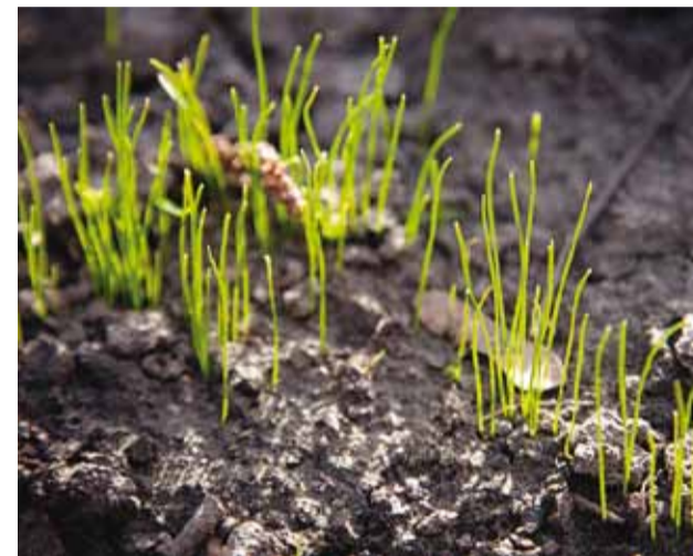
Tõde on endiselt olemas – ka tõe järgses maailmas.

Selles hetkes ja ajas, kus oleme, on tekkinud suures arvamuste hulgas väljend "tõe järgne ajastu". Ja kuigi see väljend ütleb justkui kõik, tõde on möödanik, siis siinkohal tasuks hetkeks vast hoog maha võtta ja mõelda, mis asi see tõde üldse on ja kas me ikka oleme ajas, mis sellele järgneb.