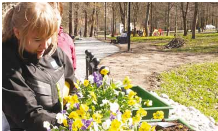
Purskkaevu ümbruse kaunistamiseks istutati lilli.