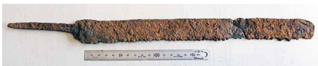
Soome lahe põhjarannikult Virasforsenilt leitud saag.

Samas moodustasid põhjalased rahvastiku hulgalta vaid tühise osa kõigest mere ääres elavatest inimestest, kes samal ajal merd sõitsid. Igal juhul teeb rahutuks teadmine, et vaid nemad suutsid Euroopas selliseid laevu valmistada, mis sellisteks retkedeks suutelised olid. Kas pole kummaline?