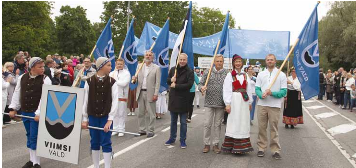
Viimsi valla esindus rongkäigus koos presidendi Kersti Kaljulaidiga.

1-häälsed mudilaskoorid: Viim- si Kooli 1. klasside mudilas- koor, Haabneeme Kooli 1. klas- side 1-häälsed mudilaskoor; las- tekoor: Viimsi Kooli lastekoor; mudilaskoorid: Haabneeme Koo- li mudilaskoor, Viimsi Kooli mu- dilaskoor, Randvere Kooli mu- dilaskoor, Püüsi Kooli mu- dilaskoor; neidukoor: Leelo vol.2; noorte sümfooniaorkester: Viim- si Muusikakooli sümfooniaor- kester; puhkpilliorkester: Viim- si Muusikakooli puhkpilliorkes-