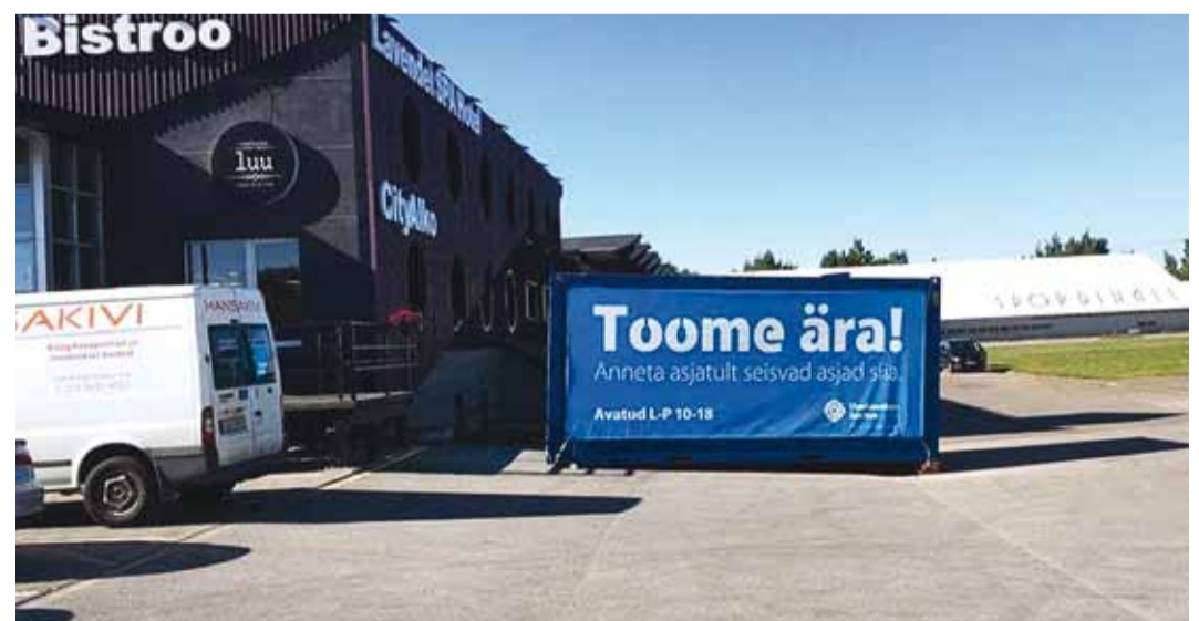
Konteiner Lavendli poe lähedal.

Uuskasutuskeskuse eesmärk on saata kasutatud asjad ringlusesse, teha asjade anneta-