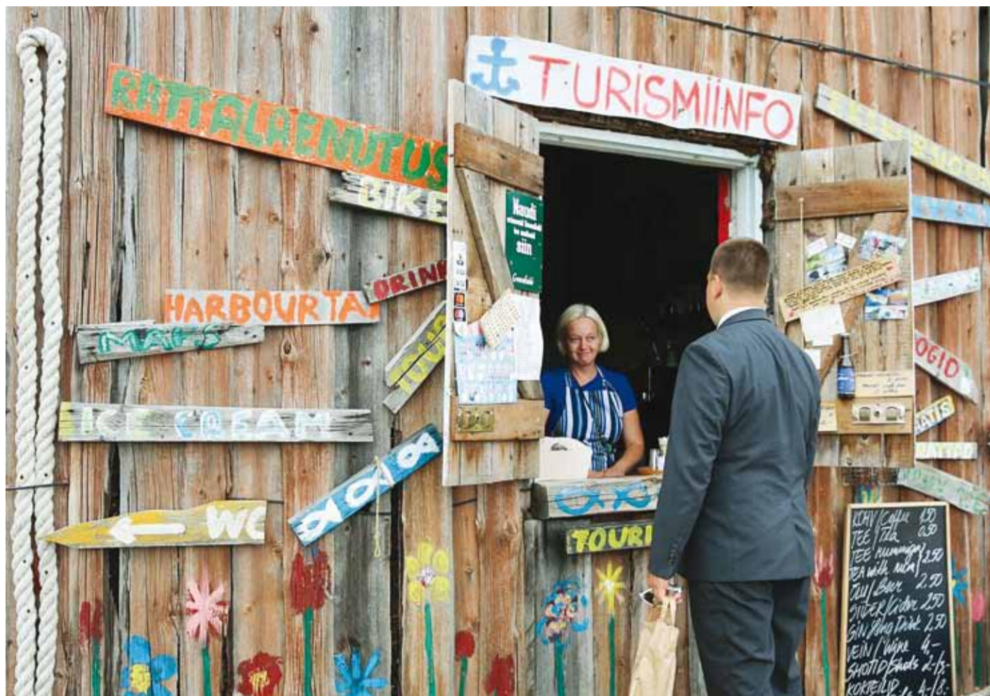
Peaminister on saabunud Prangli saarele.