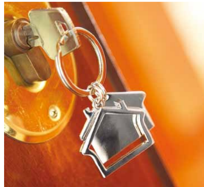
Suurematel kui 20 m 2 pinnaga hoonete ehitamisel peab olema seaduslik alus.

Kontrollimisel lähtutakse korraaitseaduses ja ehitusseadustikus kehtestatud riikliku järelevalve sätetest. Kontrollimise käigus selgitatakse eelkõige välja ehitise ehitamise õiguslik alus, ehitise ehitisealune pind, ehitise kasutamise otstarve, ehitamise aeg, vajaduse korral ehitise varasema ümberehitamise, laiendamise või lammutamisega seonduv teave ning muud olulised asjaolud. Kui kin-