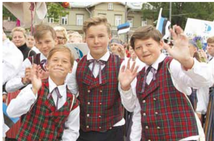
Püüsi Kooli 5.–6. klasside rahvatantsurühm.