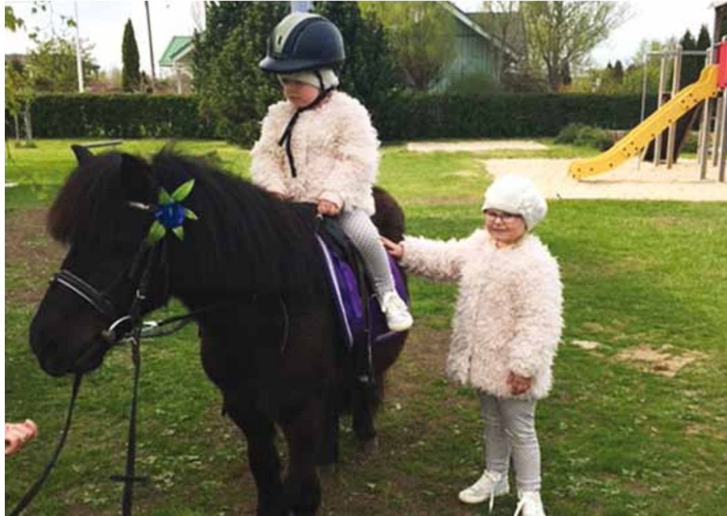
Kelvingi eralasteaias saavad lapsed loomadega aega veeta ja õpivad nende eest hoolitsema.