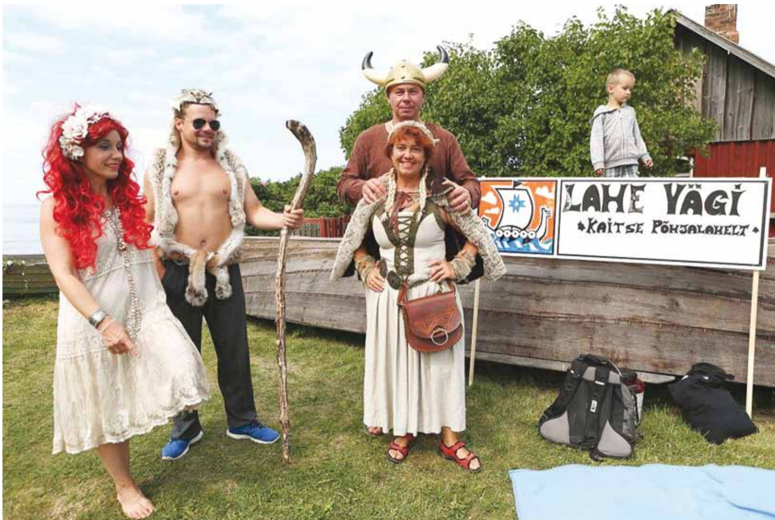
Leppneeme küla viikingid ja merineitsid pälvivad kogukonnapäeval eripreemia stiilse riietuse eest.

Juuliku viimasel nädalavahetusel toimus Viimsis taas traditsiooniline Rannarahva festival, mille raames said külastajad vabaõhmuuseumis tutvuda rannarahva kaluriküla ajaloo ja kultuuriga, külastada sadamaid ja kodaeadades sisse seatud kohvikuid.