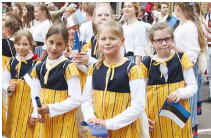
Viimsi Kooli mudilaskoor.