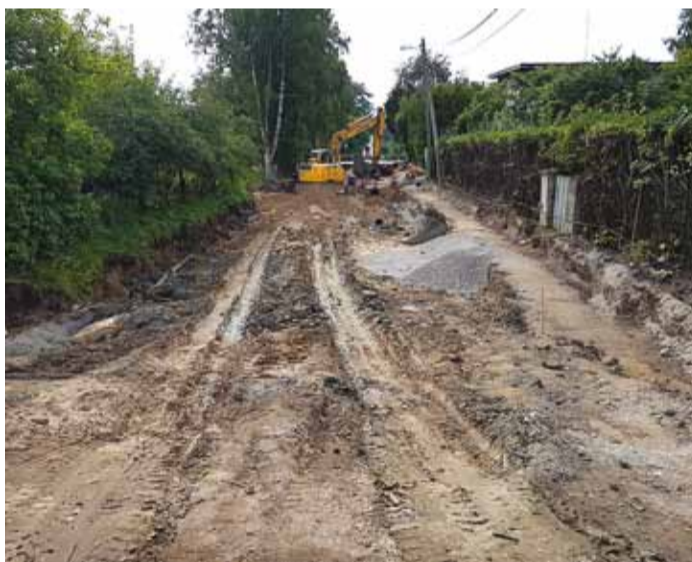
Kesk tee rekonstrueerimine.

mistingimuste kui ka ehitusloa vaidlustamise osas. Kommunalaamet teeb tööd, et leida kompromissi vaidlustajatega. Seetõttu võib tööde valmimise tähtaeg pikeneda kuu võrra. Peatöövõtja Verston Ehitus OÜ, alltöövõtjad ning valla esindajad pingutavad, et tööd valmiks võimalikult kvaliteetselt ja kiiresti. Hetkel on eemaldatud vana kate ja tee alus, ehitatakse ulatuslikke kommunikatsioone sivevõrgust kuni sademevee puhastussüsteemideni.