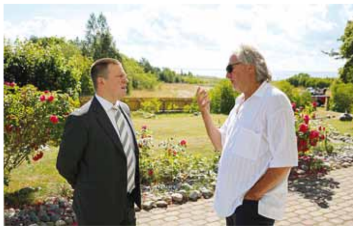
Naissaarel käis peaminister Omari küünis toimunud teater NO99 lavastuse "Revolutsioon" proovi vaatamas ja kohtus Tõnu Kaljustega.

Lääne-Eestis. Prangli, aga ka Naissaare või Aegna elanike soovid ja mured on sama tähtsad kui need on teistes Eesti asulates. Siinsetel noortel peab