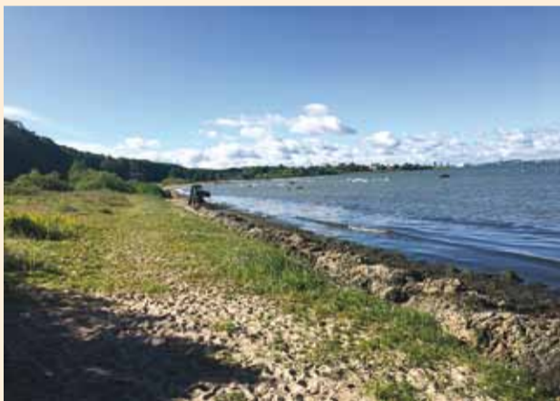
Adru koristamine Haabneeme rannas.

Articard OÜ osutab rannavalveteenust Haabneeme rannas esimest aastat. Kuna rannailma on olnud suhteliselt vähe, siis on peamiselt tehtud tööd koeraomanikega, kes tulevad koeraga randa jalutama. Enamuses on muidugi tegemist ümberkaudsete elanikega, kes on harjunud seal oma lemmikutega jalutama. Rannailmad juulis töid kaasa ka teisi probleeme, sh rannaalal grillijad, prügistajad, purjus rannaala kasutajad ja klaastaara rannaalal.