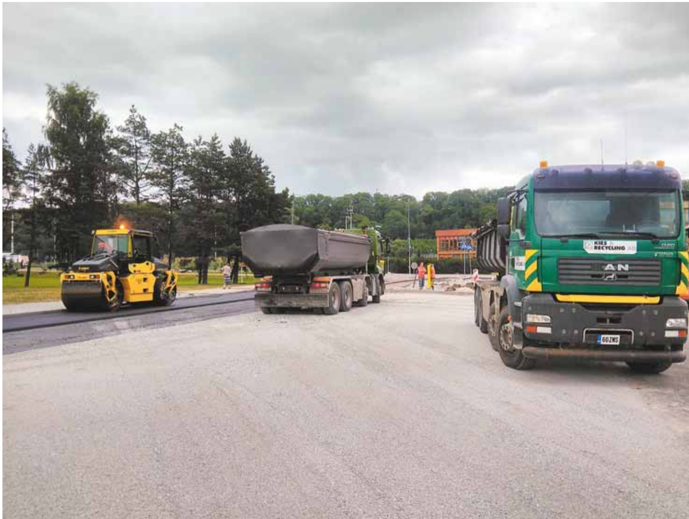
Ravi tee rekonstrueerimine.

Heki tee ja Kesk tee ehitustööd said alguse juunikuus. Käimas on kaevetööd ning algust on tehtud trasside rajamisega. Tööde kulgu on aeglustanud kahetsusväärne juhtum linnupesadega, kus heki langetamisega said üksikud pesad kahjustatud. Raietöödest puutumata jäänud nuusehekk on keskkonnainspektsiooni ja ekspertide poolt läbi vaadatud ning hekest leiti üks asustatud mustmäta pesa. Selles osas on tehtud keskkonnainspektsiooni poolt Viimsi vallavalitsusele palve oodata kuuseheki raietöödega kuni 14. augustini, mil pesas olevad linnupojad on pesast lahkunud. Raietöödega oodatakse kuni pesa on lindude poolt hüljatud. Tööde kulgu on mõjutanud ka kohtuvaidlused nii projektee-