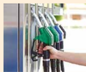
Augusti lõpuks saab tankla Prangli saarel valmis.

Väikesaarte programmi toel rajatakse Prangli saarele Kelnase sadama territooriumile 5000-liitrise mahutiga väike automaattankla, millest on võimalik saada bensiini 95 ja diiselkütust.