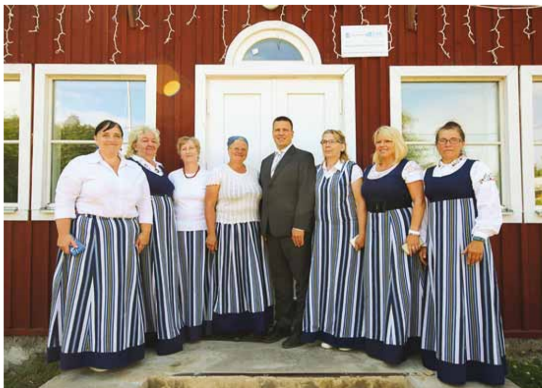
Prangli rahvaröivas naised koos peaminister Jüri Ratasega.

"Väikesaarte kogukondade küsimused on minu jaoks südamelähedane teema ning ma olen saarerahva külalislaskuse eest väga tänulik," sõnas Jüri Ratas kohtumisel saarte elanikega. "Eesti riigi ja kogukondade elujõulisus on väikesaartel sama oluline kui Kagu- või