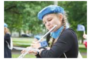
Viimsi Muusikakooli puhkpilli- orkester.

ter; segakoor: Viimsi Kooli noor- tekoor.