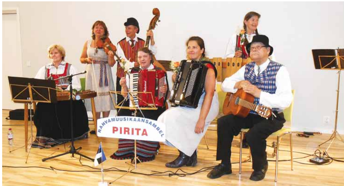
Viimsi huvikeskuse rahvamuusikaansambel Pirita kontsertreisil Lõuna-Rootsis.

30. juunil esinesime Jämjö vanadekodus ja saime rohkearvulise publiku poolt üllatavalt